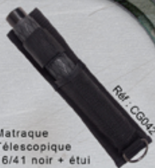
Matraque Télescopique 16/41 noir + étui