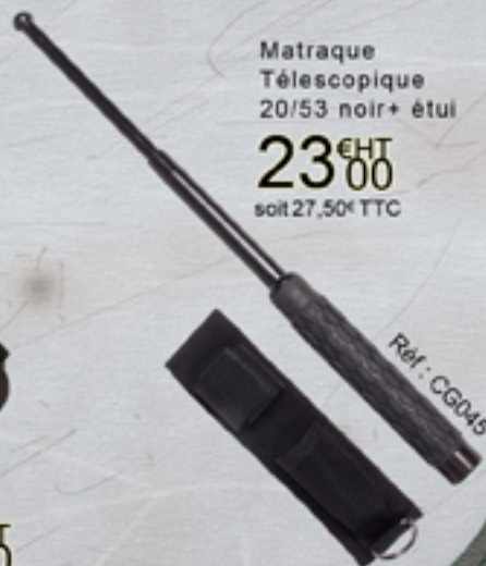
Matraque Télescopique 20/53 noir+ étui