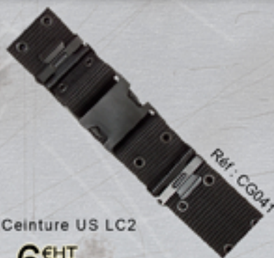
Ceinture US LC2